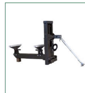
Lav side lift