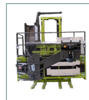
Pakker med svinglæsser